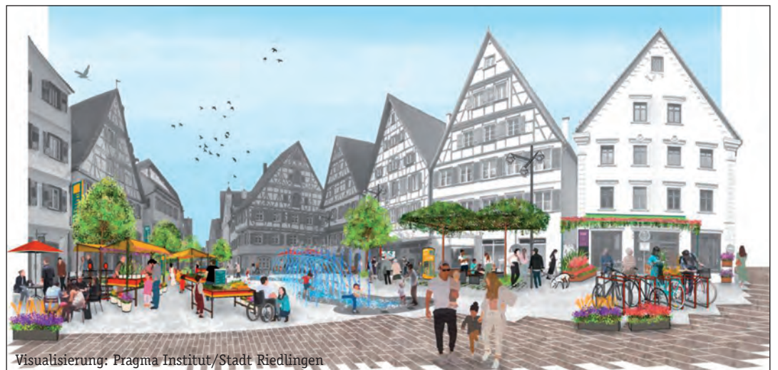
Visualisierung: Pragma Institut / Stadt Riedlingen